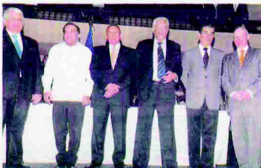
Del 15 al 17 de mayo, los comisionados gestionarán el apoyo para el proceso de reforma a la seguridad pública.

El 26 de octubre del 2012 (ayer, seis meses), la Comisión