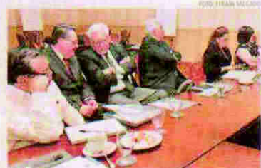
La CRSP socializó la propuesta del "Plan de estudios de educación policial".

Tegucigalpa. Con el propósito de generar un diálogo orientado a lograr consensos, la Comisión de Reforma de la Seguridad Pública (CRSP) socializó la propuesta "Plan de estudios de educación policial". En la actividad participan los miembros de la CRSP, autoridades y técnicos de la Policía Nacional, UNAH y Centro de Estudios de Investigación y Promoción de los Derechos Humanos (Ciprodeb), entre otros. "El plan de estudios de Educación Policial que propone la CRSP actualizó el modelo vigente potenciando la defensa de los derechos humanos, la ética, los valores, la equidad de género, la transparencia, la formación ciudadana y una relación