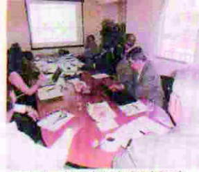
Los especialistas chilenos y los hondureños trabajan en la formación de la Policía Comunitaria.

socializarlas y asegurarnos que se lleve a cabo un proceso de fortalecimiento de las capacidades, de la formación y los niveles éticos de los jueces", señaló. Para la evaluación de los jueces, según indicó, son muchos los elementos que se pueden enumerar, pero preliminarmente tienen que ver con el mejoramiento del proceso de nombramiento de los magistrados de la CSJ. "Actualmente tienen una Ley Orgánica que crea la comisión nominadora que presenta 45 candidaturas al Congreso Nacional, nosotros creemos que esa ley debe ser reemplazada para asegurar que realmente la gente de mayor capacidad y ética profesional sean nombrados como magistrados de la Corte Suprema de Justicia y a la vez que firmen carrera judicial", añadió. "También dentro de los proyectos está un mecanismo que nos permita verificar la calidad de las sentencias y fallos del Poder Judicial, mediante una anticorrupción que deberá tener ese Poder del Estado para poder asegurarnos la excelencia para impartir justicia", enfatizó. Desde hace varios meses, diferentes sectores de la sociedad, incluido el propio fiscal adjunto Rogelio Dirección, se pronunciaron que era necesaria la depuración de jueces, fiscales y magistrados. Recientemente el jefe de personal de la CSJ, Roman Montiel, contrainformó la destitución de más 50 jueces y 16 servidores judiciales, tras realizar una evaluación de desempeño que se viene ejecutando desde el 2011.