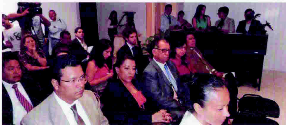
Mesa principal e invitados a la ceremonia de firma de la Carta de Entendimiento

El principal resultado de dicho acuerdo es el compromiso y apoyo ofrecido por el representante del Alto Comisionado de las Naciones Unidas para los Derechos Humanos para identificar y contratar los servicios de un equipo de expertos en reformas penitenciarias exitosas que apoyarán a ambas Comisiones en el diseño de lo que será la guía del proceso de reforma penitenciaria que demanda el país.