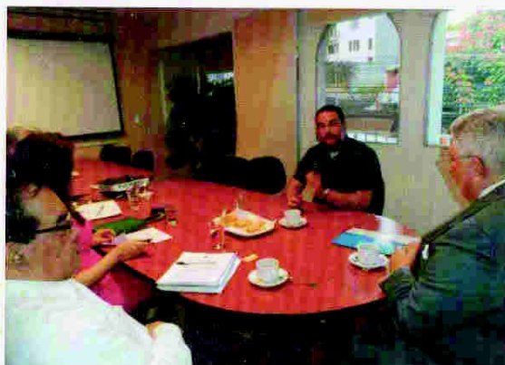
Reunión con representante del Partido Unificación Democrática (UD)