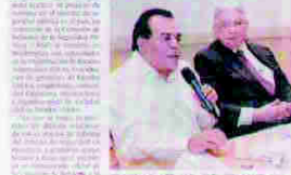
Los comisionados de la CRSP se reunirán con el secretario general de la OEA, José Miguel Insulza, en Washington.

Los miembros de la Comisión de Reforma de la Seguridad Pública (CRSP) se reunirán en Washington con el secretario general de la Organización de los Estados Americanos (OEA), José Miguel Insulza, para discutir los avances y desafíos en el proceso de mejora de la protección ciudadana de Honduras.