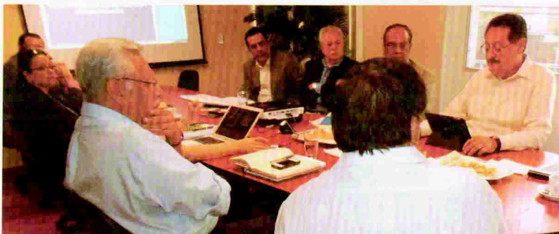
Reunión con ex Fiscales Generales de la República

En ese contexto, la Comisión sostuvo reuniones con ex Fiscales Generales del Ministerio Público con el objetivo de conocer sus valoraciones y recomendaciones sobre el proceso de reforma.