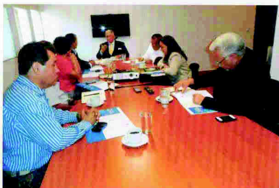
Reunión con candidato presidencial del Partido Innovación y Unidad Social Demócrata (PINU-SD)