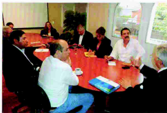
Reunión con candidata presidencial del Partido Liberal y Refundación (LIBRE)