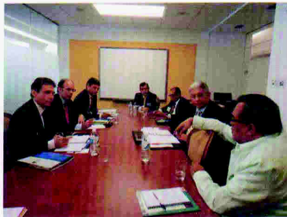
Reunión con asesores del congreso de los Estados Unidos