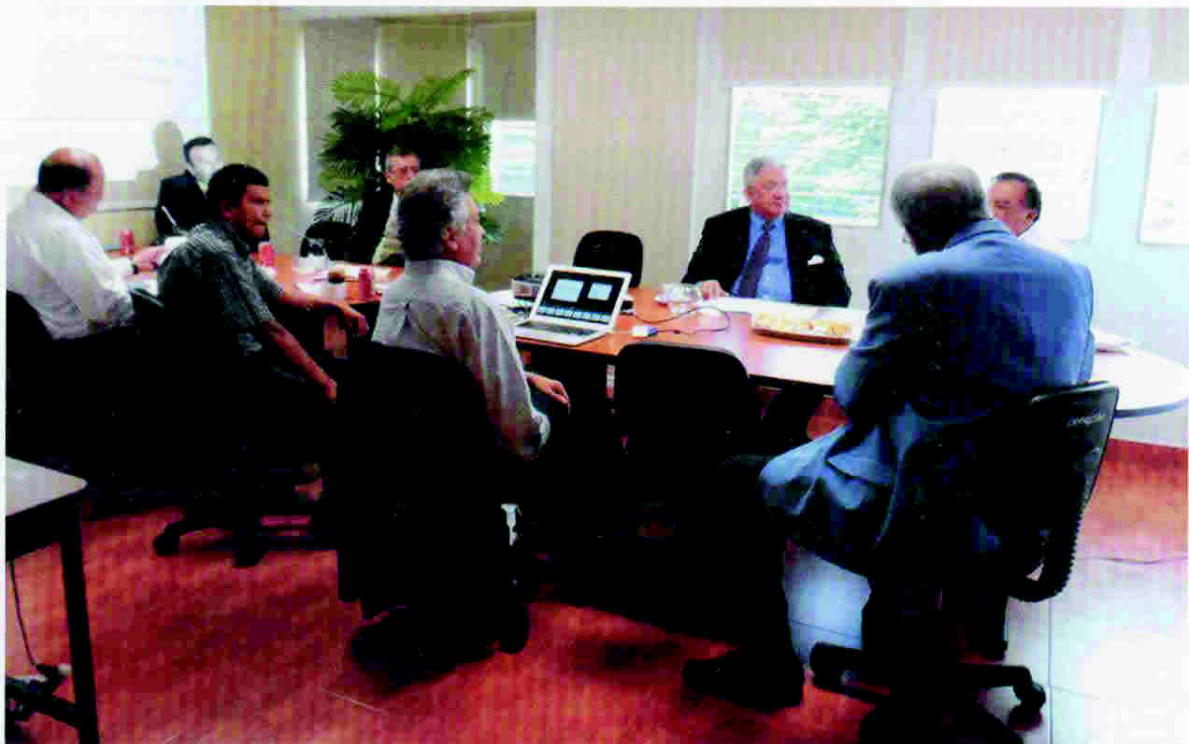
Comisionados de la CRSP junto a los miembros de la mesa de trabajo

En abril de 2013, la Comisión de Reforma de la Seguridad Pública (CRSP) instaló la mesa de trabajo «Sistema Nacional de Inteligencia» integrada por representantes designados por la Dirección Nacional de Investigación e Inteligencia (DNII), la Oficina de Relaciones Informativas y Sociales (ORIS) y la Secretaría de Seguridad, quienes bajo la coordinación de la Comisión y con la asistencia de un consultor internacional, trabajaron en un primer borrador del Sistema Nacional de Inteligencia y su correspondiente ley. A la fecha, ya ha sido elaborado el documento propuesta sobre lo que debe ser un Sistema Nacional de Inteligencia, con sus correspondientes áreas de inteligencia militar, policial y estratégica. También ha sido elaborado ya el primer borrador de lo que deberá ser una ley que regule todo el sistema.