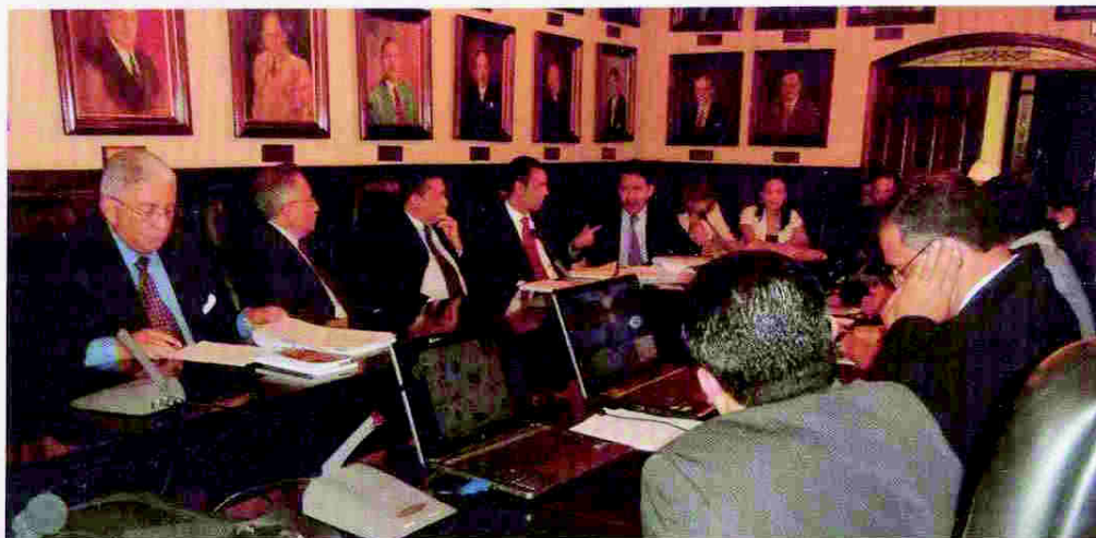
Mesa de trabajo instalada por el Congreso Nacional de la República

La propuesta plantea que: es necesario dotar al Ministerio Público de una Dirección Técnica de Investigación para delitos complejos y de alto impacto social; corresponderá a los fiscales la dirección técnica jurídica de la investigación, con lo cual se aseguran los resultados en las investigaciones y lucha contra la impunidad; se debe privilegiar la meritocracia sometiendo a concurso los cargos de Directores y Fiscales Especiales; se deberá crear un mecanismo de evaluación permanente del desempeño; la aplicación de pruebas de confianza al personal actual y de nuevo ingreso; el Consejo Ciudadano sea un órgano de auditoría social, de apoyo y de consulta; y la creación de la Carrera del Servidor del Ministerio Público.