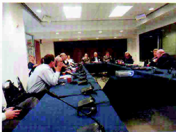
Reuniones con diferentes actores de sociedad civil en Washington