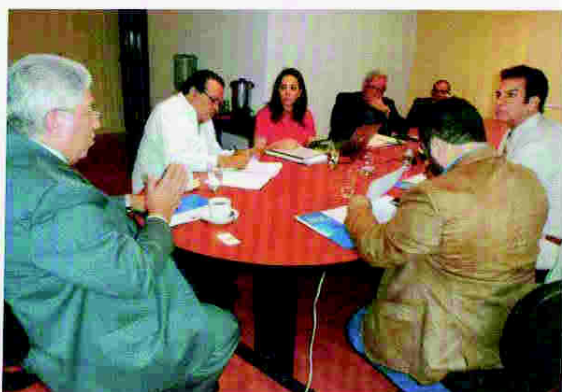
Reunión con candidato presidencial del Partido Anticorrupción de Honduras (PAC)