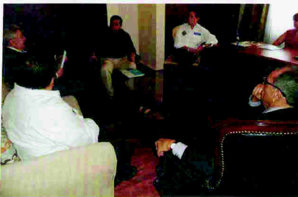
Reunión con candidato presidencial del Partido Alianza Patriótica Hondureña (APH)