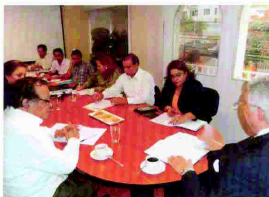
Reunión con candidato presidencial del Partido Frente Amplio Político Electoral en Resistencia (FAPER)