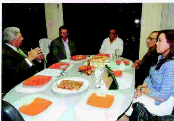
Reunión con candidato presidencial del partido Liberal de Honduras (PLH)