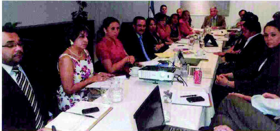
Reunión con Fiscales del Ministerio Público

De igual manera, la CRSP desarrolló junto a Fiscales y diferentes organizaciones de la sociedad civil, intensas jornadas de trabajo que dieron como resultado una propuesta consensuada que se entregó en julio del presente año al Congreso Nacional para su discusión y aprobación.