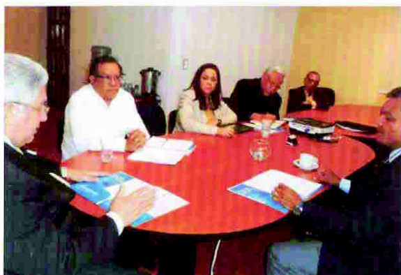
Reunión con candidato presidencial del Partido Demócrata Cristiano de Honduras (PDCH)