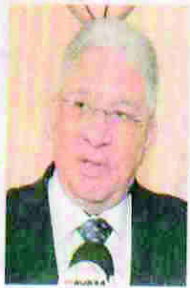
Jorge Omar Casco

socializarlas y asegurarnos que se lleve a cabo un proceso de fortalecimiento de las capacidades, de la formación y los niveles éticos de los jueces", señaló. Para la evaluación de los jueces, según indicó, son muchos los elementos que se pueden enumerar, pero preliminarmente tienen que ver con el mejoramiento del proceso de nombramiento de los magistrados de la CSJ. "Actualmente tienen una Ley Orgánica que crea la comisión nominadora que presenta 45 candidaturas al Congreso Nacional, nosotros creemos que esa ley debe ser reemplazada para asegurar que realmente la gente de mayor capacidad y ética profesional sean nombrados como magistrados de la Corte Suprema de Justicia y a la vez que firmen carrera judicial", añadió. "También dentro de los proyectos está un mecanismo que nos permita verificar la calidad de las sentencias y fallos del Poder Judicial, mediante una anticorrupción que deberá tener ese Poder del Estado para poder asegurarnos la excelencia para impartir justicia", enfatizó. Desde hace varios meses, diferentes sectores de la sociedad, incluido el propio fiscal adjunto Rogelio Dirección, se pronunciaron que era necesaria la depuración de jueces, fiscales y magistrados. Recientemente el jefe de personal de la CSJ, Roman Montiel, contrainformó la destitución de más 50 jueces y 16 servidores judiciales, tras realizar una evaluación de desempeño que se viene ejecutando desde el 2011.