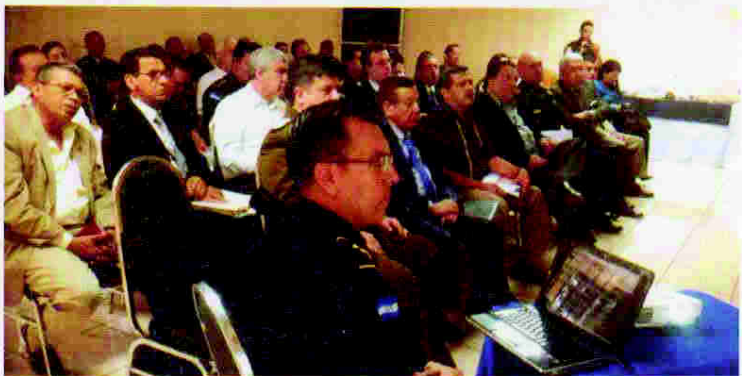
Reunión con diferentes sectores involucrados en el tema de seguridad ciudadana