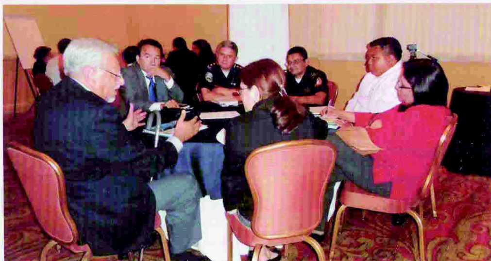
Participantes de una mesa de análisis del taller de socialización de la propuesta «Plan de Estudios de la Carrera de Servicios Policiales»