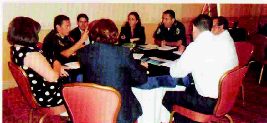
Participantes del taller de socialización de la propuesta «Plan de Estudios de la Carrera de Servicios Policiales»